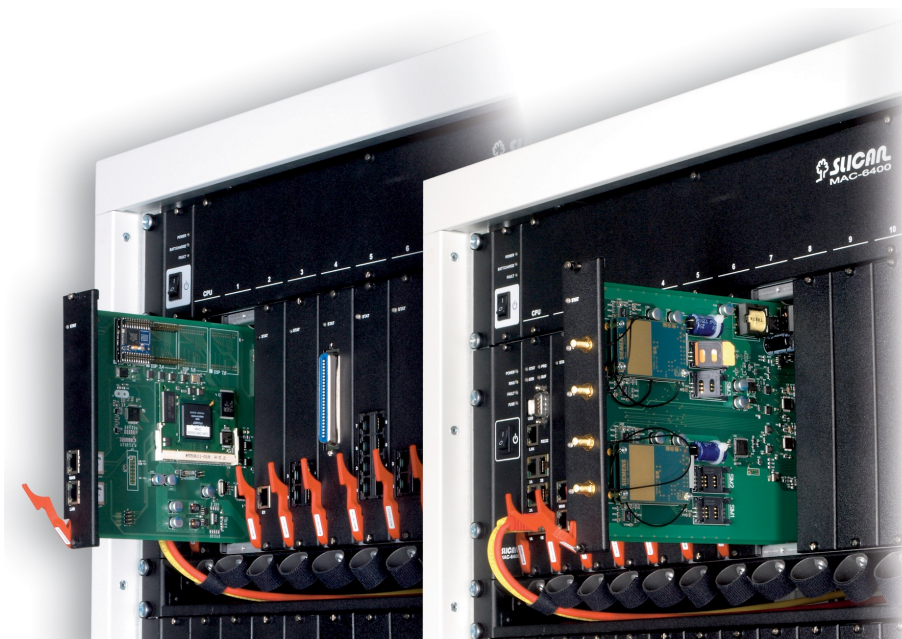
■ MODUŁ VoIP W MAC-6400